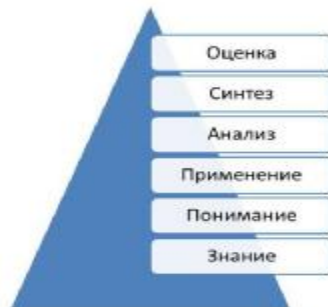
Рис 2. Таксономия Б. Блума

При формировании заданий можно использовать различные способы. На наш взгляд, эта проблема разрешима на основе таксономии Б. Блума 1 (рис. 2). Несмотря на то что полностью названия уровней не совпадают, легко провести параллели: узнаем мы только то, что знаем, можем воспроизвести то, что понимаем.